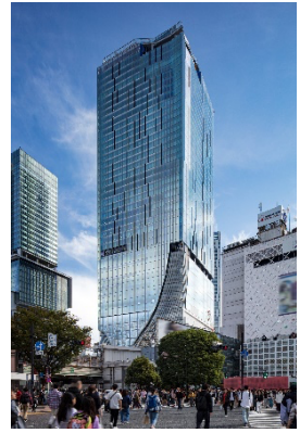
▲渋谷スクランブルスクエア外観

名称： 渋谷スクランブルスクエア／SHIBUYA SCRAMBLE SQUARE 事業主体： 東急(株)、東日本旅客鉄道(株)、東京地下鉄(株) 所在： 東京都渋谷区渋谷2丁目24番12号 用途： 事務所、店舗、展望施設、駐車場など 延床面積： 第Ⅰ期(東棟)約181,000㎡、第Ⅱ期(中央棟・西棟)約96,000㎡ 階数： 第Ⅰ期(東棟)地上47階 地下7階、 第Ⅱ期(中央棟)地上10階 地下2階、(西棟)地上13階 地下5階 高さ： 第Ⅰ期(東棟)約229.7m、第Ⅱ期(中央棟)約61m、(西棟)約76m 設計者： 渋谷駅周辺整備計画共同企業体 ※(株)日建設計、(株)東急設計コンサルタント、(株)JR東日本建築設計、 メトロ開発(株) デザイナー/アキテクト： (株)日建設計、(株)隈研吾建築都市設計事務所、(有)SANAA 事務所 運営会社： 渋谷スクランブルスクエア(株) ※東急(株)、東日本旅客鉄道(株)、東京地下鉄(株)の3社共同出資 開業： 第Ⅰ期(東棟)2019年11月1日 第Ⅱ期(中央棟・西棟)2027年度 URL： https://www.shibuya-scramble-square.com